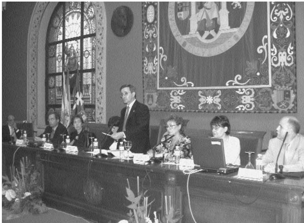
El Paraninfo de la Universidad de Zaragoza fue el escenario en el que la institución agradeció a las empresas que colaboren en la colocación de titulados