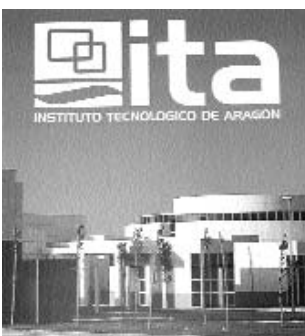
Edificios del Instituto Tecnológico de Aragón

Fue director general de Bienestar Social y Trabajo y posteriormente trabajó como director general de Promoción y Desarrollo Económico del Gobierno de Aragón. Hasta su incorporación como director del ITA, el 2 de septiembre de 2003, ha sido jefe del Servicio de Fomento Industrial en el Departamento de Industria, Comercio y Turismo.