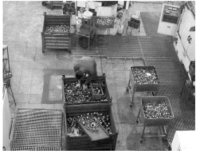
Trabajador de una sociedad laboral del sector del metal

La temporalidad se destaca así como el primer reto, por lo que el consejero de Economía, Eduardo Bandrés, anunció que en breve se publicará un decreto que pondrá en marcha un plan de fomento del trabajo estable. El objetivo es realizar un estudio detallado de los índices de temporalidad en las empresas para dirigirse a las que presenten tasas más altas y explicarles las ventajas de la contratación indefinida.