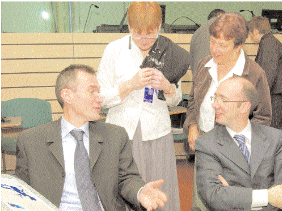
Frank Vandembroucke, ministro federal de Trabajo de Bélgica (a la izquierda), conversa con el ministro belga de Asuntos Sociales, Rudy Demotte