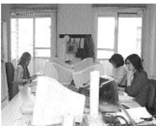
Trabajadoras de una empresa de economía social

Como dato positivo se señala el aumento de la conversión de contratos temporales en fijos, ya que las 19.366 conversiones registradas superan el número de nuevos contratos indefinidos firmados y suponen un aumento del 7,96% respecto a 2002, cuando el índice nacional ha sido del 2,6%.