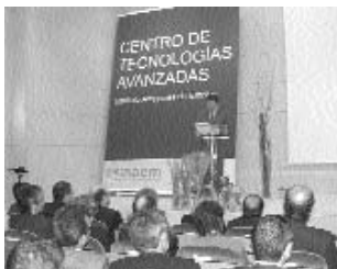
Acto de inauguración de la nueva sede del INAEM