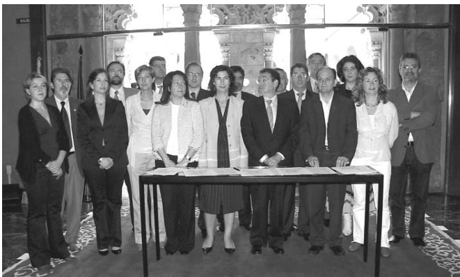
Foto de familia de los firmantes del acuerdo

Los datos del Estudio de Población Activa del INEM para el primer trimestre de 2005 señalan que de las 596.400 personas que configuran este sector en Aragón, sólo 36.600 se encuentran en situación de desempleo. Pese a que los datos son positivos, en el ámbito femenino no lo son. Mientras que 16.000 hombres están parados, las mujeres en circunstancias similares son 20.500. Así, su tasa de paro es del 8,49% -la masculina es del 4,55%- y sitúa a Aragón como la octava comunidad en porcentaje de actividad femenina, traducándose en uno de los más graves problemas del mercado de trabajo. Con el fin de buscar soluciones a esta coyuntura, las organizaciones empresariales, sindicatos y partidos políticos con representación parlamentaria en Aragón firmaron