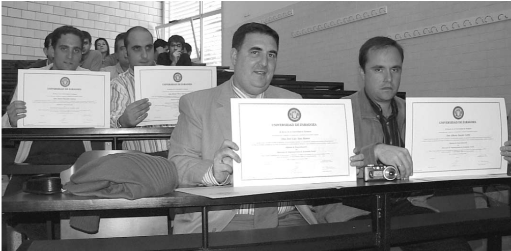
Los nuevos expertos en dirección de sociedades laborales recibieron sus diplomas en el marco del seminario anual de Economía Social