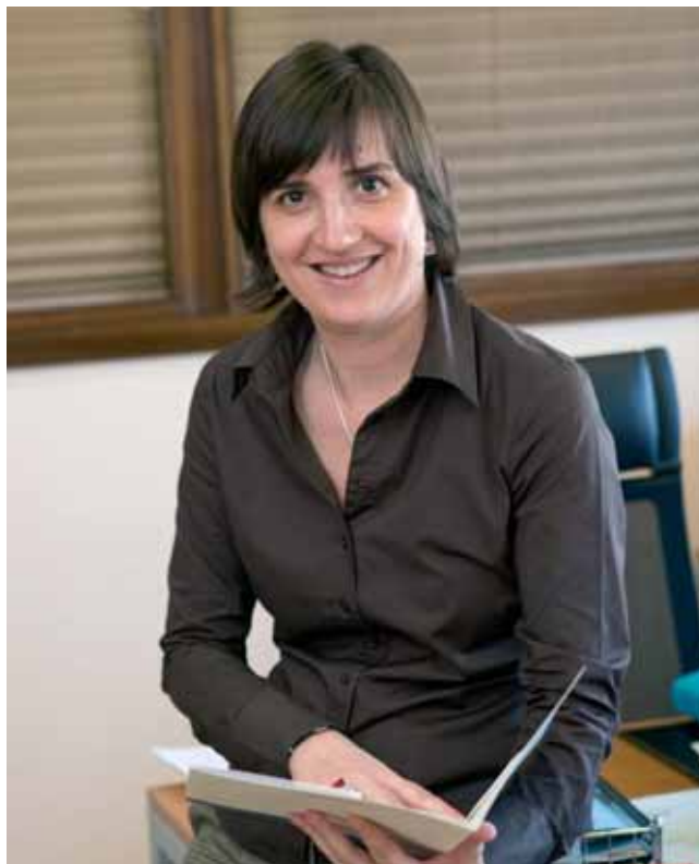
La vicepresidenta de Zaragoza Dinámica afirma que el sector de la economía social está “en pleno auge”

R.- Afortunadamente las nuevas tecnologí-