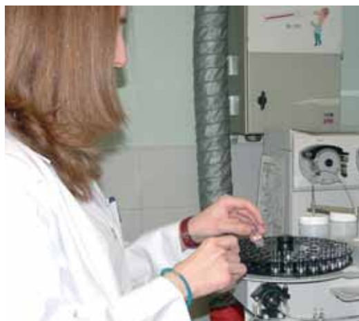
Cada vez más mujeres ponen en marcha un negocio en el sector sanitario

Además, durante los días 31 de marzo y 1 de abril se desarrollarán seminarios y talleres. La primera jornada (Día del Emprendedor) se orienta a aquellos que se plantean crear una tienda virtual y la segunda (Día del Vendedor) está dirigida expresamente a los expositores que quieran aumentar sus conocimientos y profundizar en aspectos clave del comercio electrónico, guiados por expertos del máximo nivel.