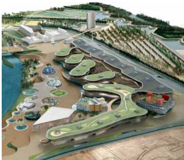
El eje central de la Expo, "Agua y Desarrollo Sostenible", ha motivado la organización del evento

La cumbre empresarial mundial sobre agua y desarrollo sostenible se articulará