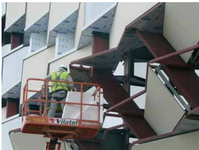
La desaceleración en la economía en 2008 se verá minimizada en Aragón por el efecto Expo

cuenta es que el número de paradas disminuyó en 600 personas, de manera que se ha compensado en parte el incremento de trabajadores masculinos parados (un 21,14% más que en 2006). De todas formas, el paro femenino (6,53%) es muy superior al masculino (4,02%) y la tasa de actividad de las mujeres (50,05%) se sitúa 17,9 puntos por debajo de la de los hombres (67,94%).