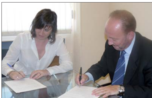
Ranera y Romero renovaron el convenio para el fomento de la economía social