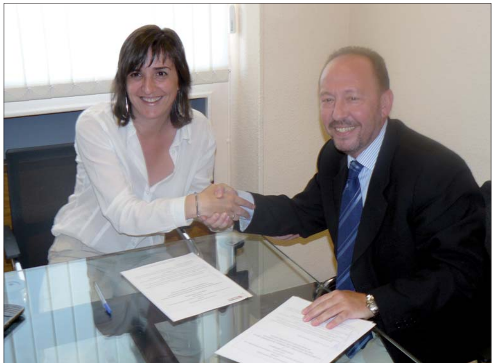
Zaragoza Dinámica y ASES promocionan la actividad económica y empresarial de la capital aragonesa