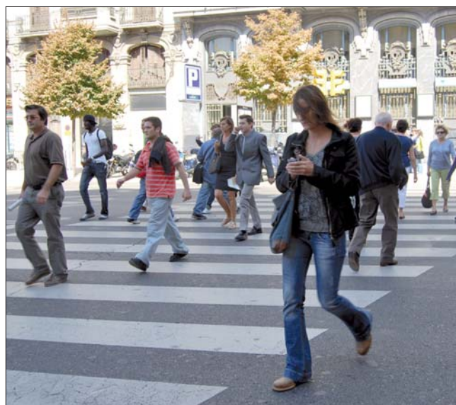
La capital aragonesa ha registrado el mayor incremento, con 1.146 desempleados más

Por otra parte, aumenta el paro en 41 provincias, encabezadas por Barcelona, con 17.925, y por Madrid, 8.495 personas más. Por otro lado, en once de las provincias el paro ha descendido, entre las que destacan Las Palmas con 489 parados menos, Melilla con 420 y Navarra con 339.