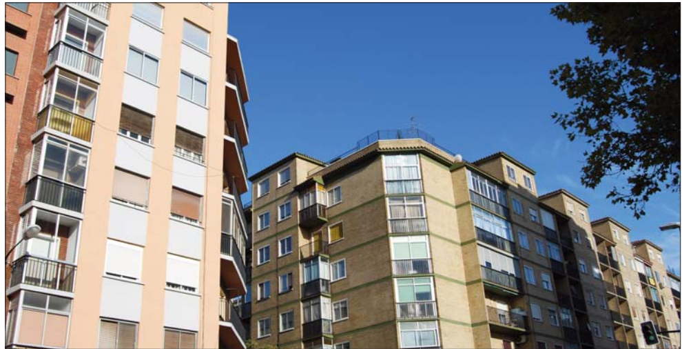
El número de fincas transmitidas en julio a nivel nacional ha sido de 158.490

Por provincias, Zaragoza registró un total de 923 de viviendas en compraventa en junio; seguida de Huesca, con 262, y Teruel, con 88. Por otra parte, en la capital aragonesa se alcanzaron 4.413 fincas transmitidas, mientras que Huesca y Teruel han registrado un total de 1.683 y 834, respectivamente.