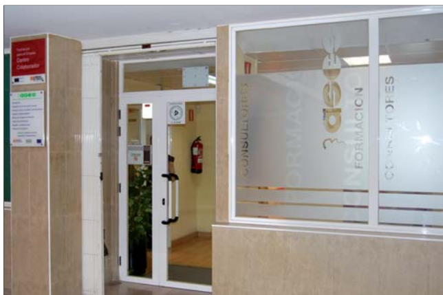
ASES cuenta con una adecuada capacidad humana, técnica y de organización

"Este momento es el idóneo para que se creen sociedades laborales"